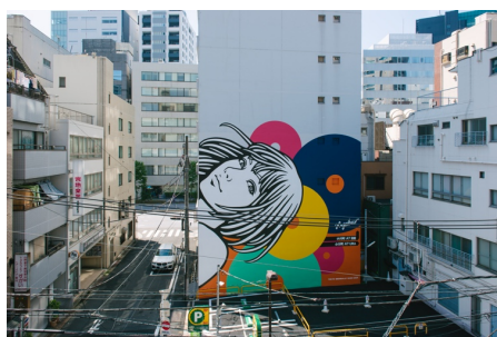
Hogalee 《Landmark Art Girl》 千代田区神田小川町、2020

その他にも、都内各所やアーツ千代田 3331周辺エリアにて、「TOKYO BENCH PROJECT 2019-2020」「タイニーハウスプロジェクト」、「動く土 動く植物」、「東京型家」他、アートプロジェクトの発表やワークショップ、シンポジウムの開催を予定しています。詳細は随時公式ウェブサイトにてお知らせいたします。